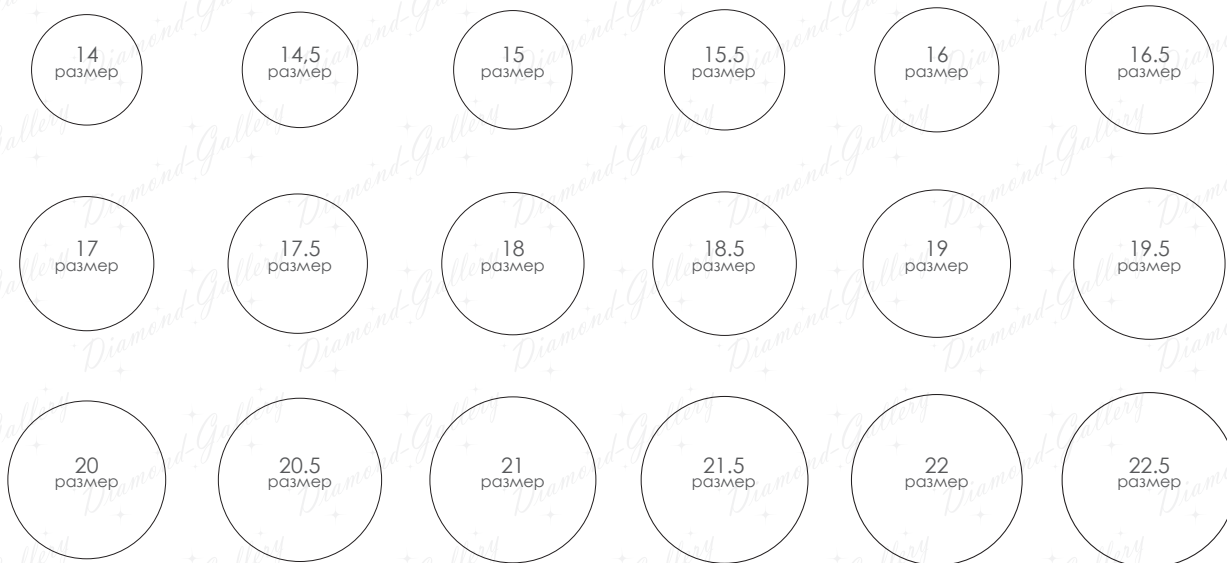
СХЕМА ОТОБРАЖАЕТ РАЗМЕРЫ КОЛЕЦ В УКРАИНЕ И СТРАНАХ СНГ